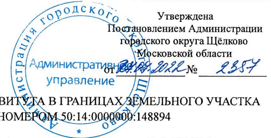
СХЕМА ГРАНИЦ ПУБЛИЧНОГО СЕРВИТУТА В ГРАНИЦАХ ЗЕМЕЛЬНОГО УЧАСТКА С КАДАСТРОВЫМ НОМЕРОМ 50:14:0000000:148894

Объект: подземные линейные сооружения (газопровод низкого давления Р≤0,003МПа) Местоположение/кадастровый номер: Московская область, г. Щёлково, дп Загорянский, ул. Щербакова (ЗУ с КН 50:14:0000000:148894) Площадь земельного участка: 83 кв.м